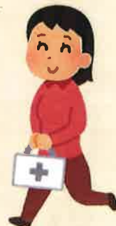
例：1 週間の訪問パターン（要介護3の方）