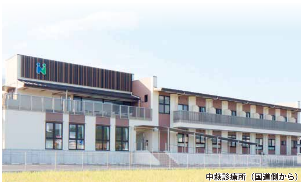
中萩診療所 (国道側から)

在宅医療の支援病棟として、在宅患者様の入院加療への切り替えや、一時入院にも対応し、安心して生活が送れるよう支えます。