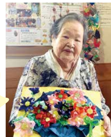
「リボンを再利用して花束作ったんよ! わいわいクラブにて。」