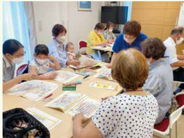
「わたしのからだのタイプはどれかな～」質問に答えて体質をチェック。

日時 10月27日(金) 10:00～11:30 場所 中萩診療所マインドホール 定員 20名になり次第しめ切ります。 お申込み・お問合せ 鍼灸院ふわり 40-2563