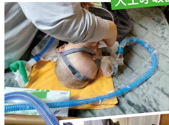
[午後1件目]痰を引いたり装置の設定を確認したり…