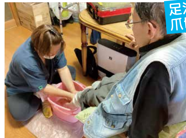
[午前2件目]痛いところはないですか?