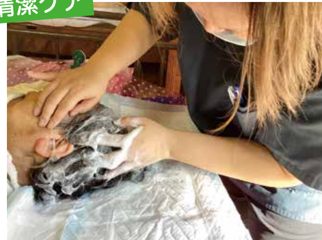
[午後3件目]洗髪、全身を拭く、着替え、おむつ交換