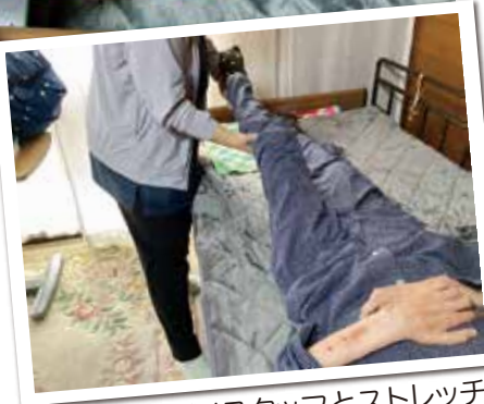
リハビリスタッフとストレッチ