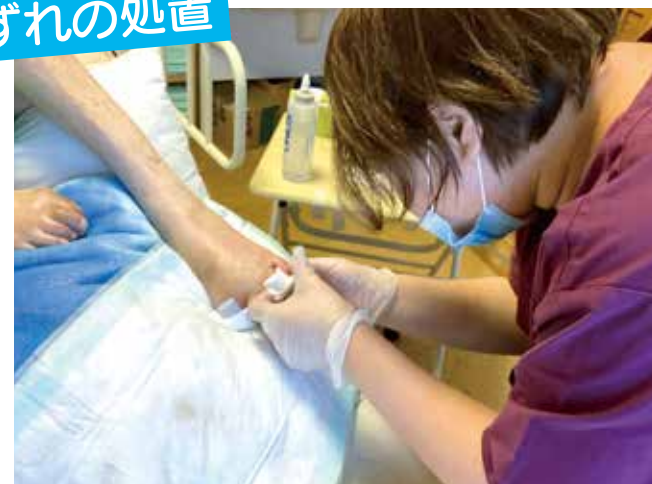
[午前1件目の訪問]状態はどうか?