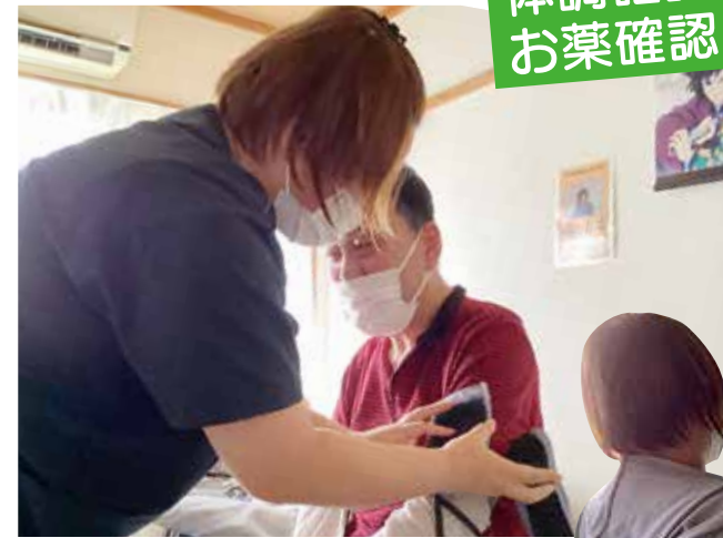
[午後2件目]血圧測定。体の調子はどうですか?