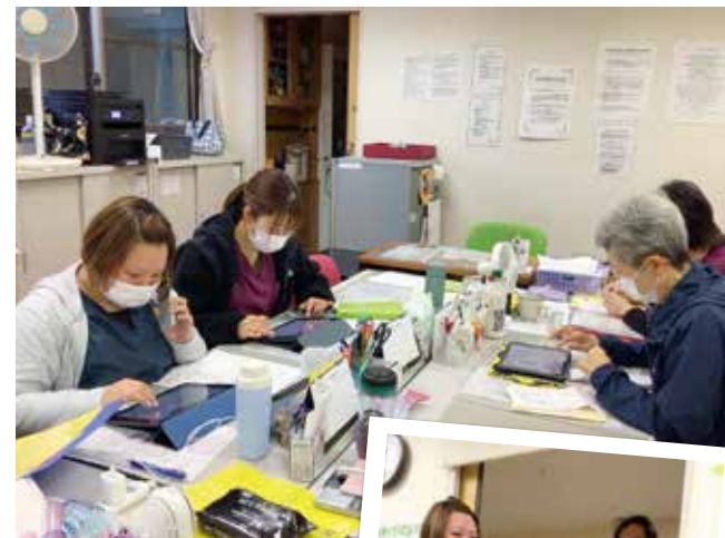
記録、連絡、スタッフ同士で情報交換や相談