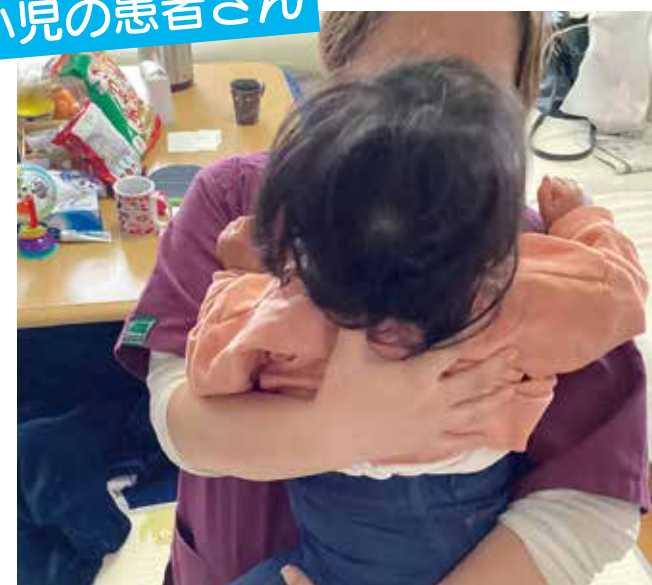
[午前3件目]1才の女の子をだっこ。調子はどうかかな~?