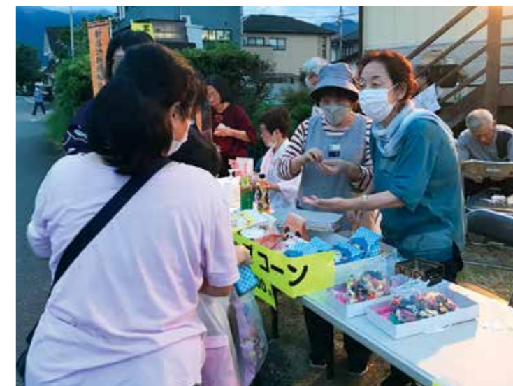
花火大会でポップコーン(金子・金栄・宮西・新居浜支部合同)