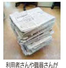
利用者さんや職員さんが 古新聞を持参してくれます