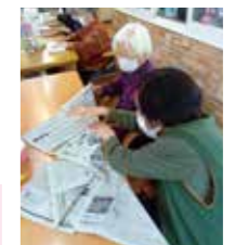
古新聞でゴミ箱づくり

7 持続可能 なエネルギー 13 気候変動 への対応 節電とCO 2 削減のため にエアコン室外機 に日よけをつけました、不要な電気 はこまめに切っています。