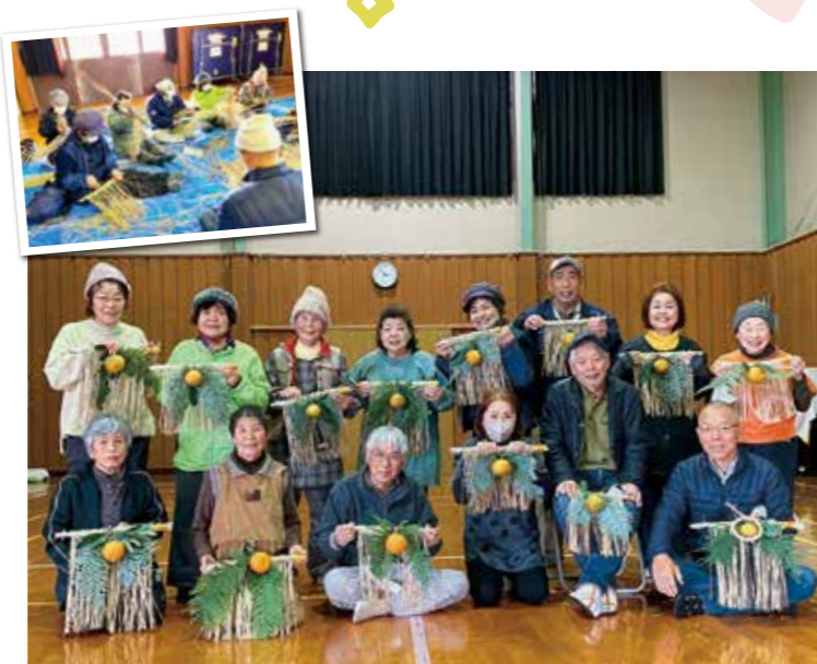
公民館でしめ縄作り(大生院支部)