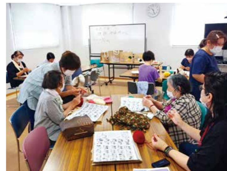
サマーバッグ作り(垣生浮島支部)