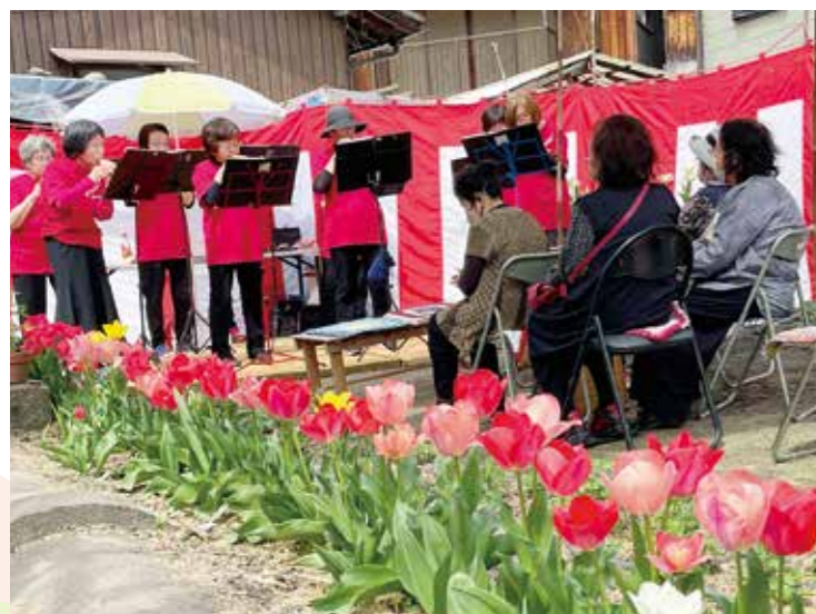
桜・チューリップそして音楽…ちよっときてみんかい♪(西条支部)