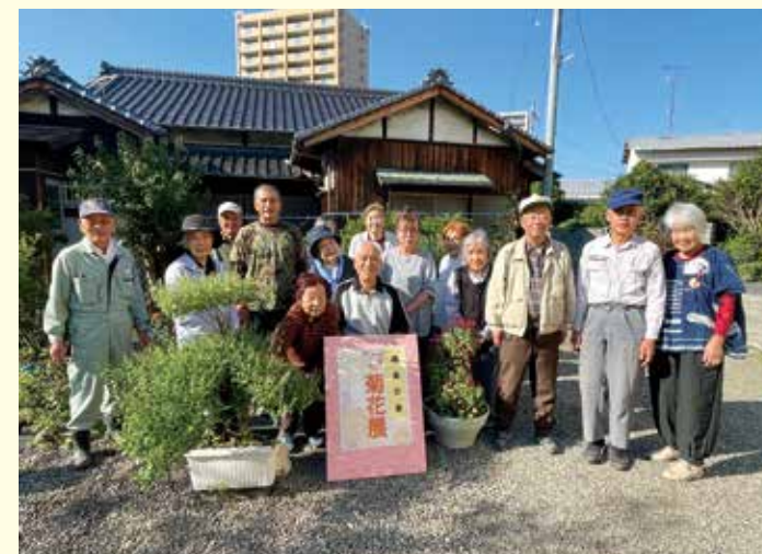
写真は昨年の様子です