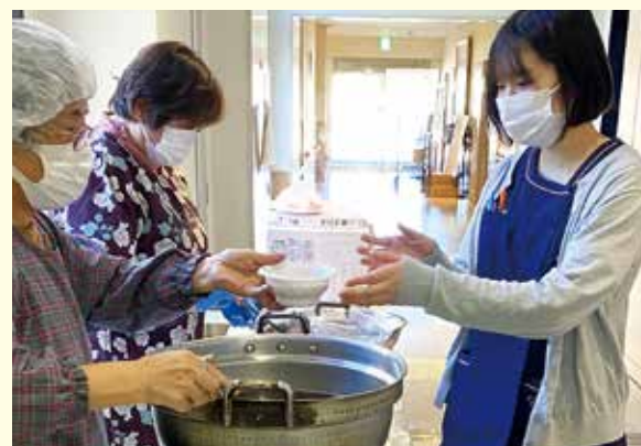
診療所でぜんざいを振る舞う