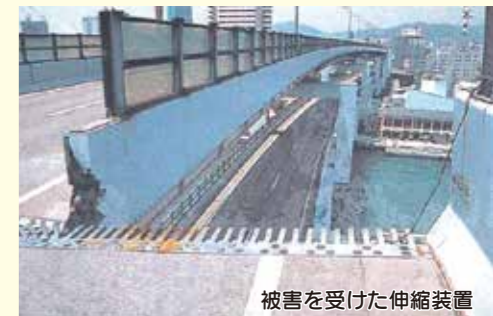
被害を受けた伸縮装置