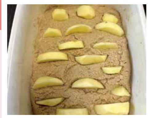
ジャガイモのでんぷんで乳酸菌が活性化